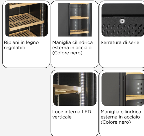
Ripiani in legno regolabili